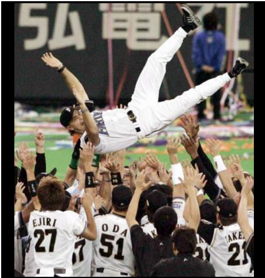
圖 2-1-1 日本職業棒球