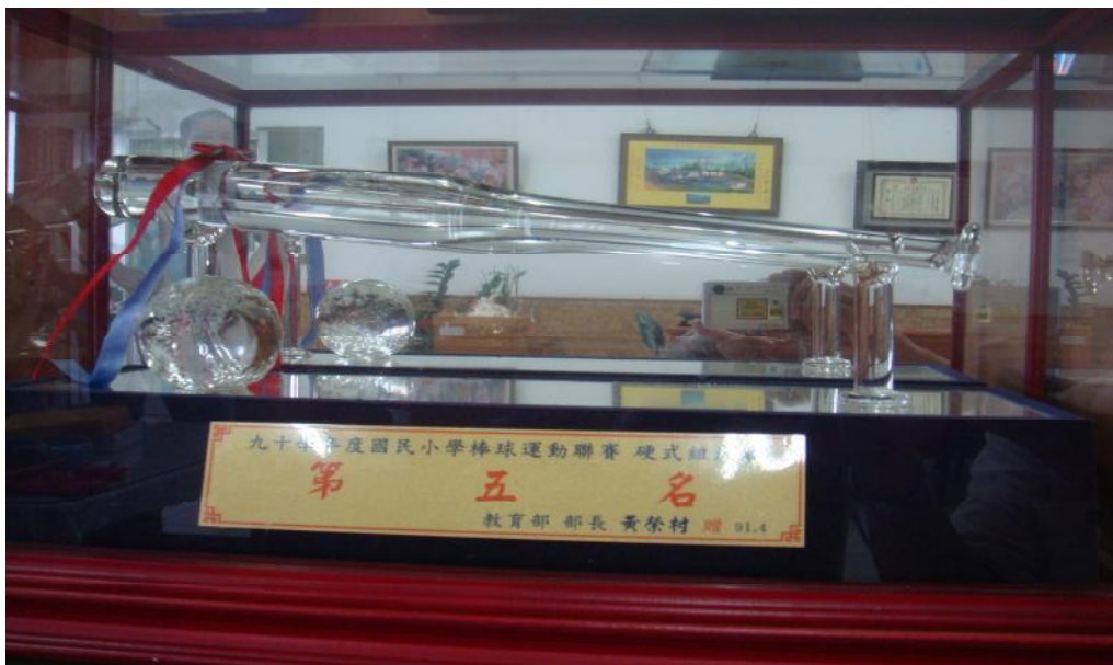
圖 4-2-2 2001 年全國少棒聯賽硬式組第 5 名獎盃