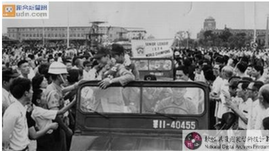
圖 2-2-3 歡迎世界冠軍 3