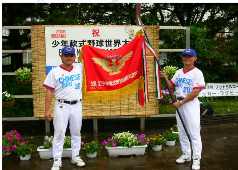
圖 4-2-3 2006 年 IBA -BOYS 世界軟式少棒冠軍