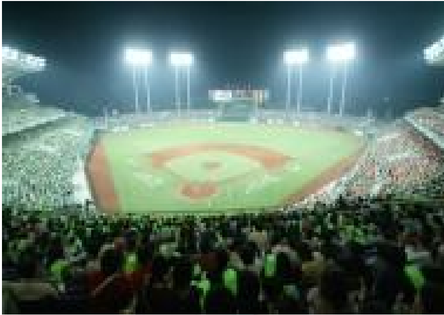
圖 2-2-6 台灣職業棒球榮景

1992 年奧運結束後，球隊數也開始增加，直到 1997 年和信鯨隊加盟，中華職棒已有七支球隊。不過此時職棒環境也出現重大轉變，由於黑道及選手介入賭博、涉嫌放水疑雲不斷，比賽真實度屢遭質疑，加上未能恰當處理危機，職棒發展方向不明，出現觀眾人數銳減的情況。最後迫使時報鷹、三商虎及味全龍等隊相繼解散。