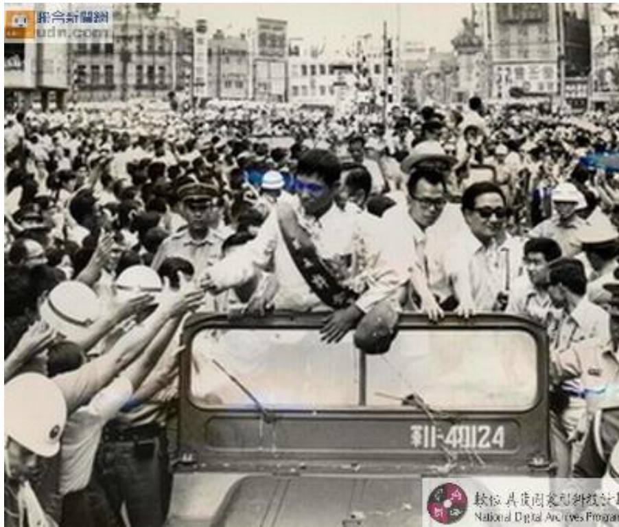
圖 2-2-1 歡迎世界冠軍 1

圖片簡述： 六十年 九月十一日 巨人少棒隊 獲得世界冠軍，返國受到全國各界盛大歡迎。