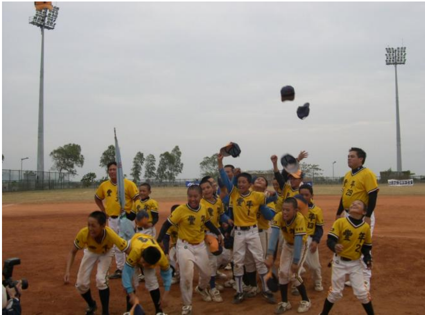
圖 4-2-1 豐年國小棒球隊獲得 2004 年第 11 屆關懷盃棒球錦標賽冠軍

圖片簡述：2004 年豐年國小在第 11 屆關懷盃少棒錦標賽冠軍戰中擊敗台東縣泰源國小，賽後選手齊升歡呼。