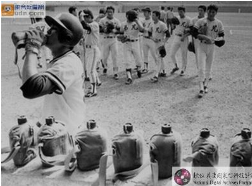
圖 2-2-5 台灣的職業棒球隊

1990 年代之後，台灣棒球的高度商業化、全球化，使其和美國、日本等職棒場域加速扣連，棒球運動在主客觀的社會情勢之下，成為職業運動的項目，它提供觀眾一個長期開放的觀賞活動與空間，每年有數百場比賽，在長達半年的時間內巡迴台灣各主要城市進行比賽，讓喜歡棒球運動的球迷們，透過對球隊與選手的支持與認同，情感有所參與與歸屬（張力可，2000）。