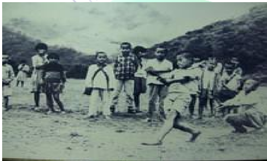
圖 1-1-2 紅葉隊以竹棍擊石經典照片