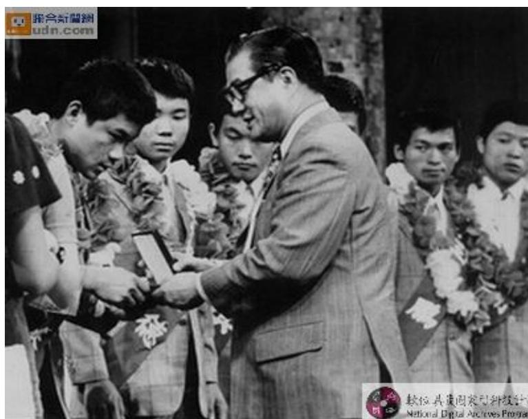
圖 2-2-2 歡迎世界冠軍 2

認定台灣穩獲冠軍。最後中華隊以 5 比 1 擊敗「美南隊」完成三連霸（謝仕淵、謝佳芬，2003）（參閱圖 2-2-2）。1974 年，金龍、美和、華興的青少棒球員均已進入高中，首屆全國青棒賽有八支隊伍參加，這是台灣正式向進軍世界青棒邁出一大步，也是對過去 5 年來少棒、青少棒運動成果的檢驗（徐宗懋，2004）。賽後中華青棒隊以全國明星隊的方式網羅了美和、華興、北體、東亞等好手，首次進軍在美國勞德岱堡舉辦的世界青棒錦標賽。美國由各社區組成的球隊，果然都不是中華隊的對手，紛紛中箭落馬，眼睜睜看著第一次參賽的中華隊登上王座（曾文誠、孟峻瑋，2004）。